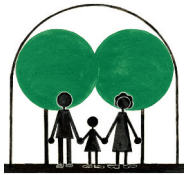
Kinder-Palliativ-Hilfe Niederbayern e.V.

Einer unserer größten Unterstützer ist die Kinder-Palliativ-Hilfe Niederbayern e.V.